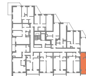
UL. GEN. MADALIŃSKIEGO