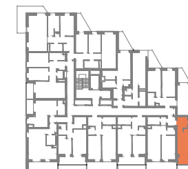
UL. GEN. MADALIŃSKIEGO